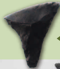
だいけいせつき ◀ 台形石器

台形石器は斜めに大きな刃部をもつナイフ形石器で、 恵庭 の火山灰よりも下層から出土することが知られています。このことから2万年以上前に作られたものと考えられ、雄武町では最古級の石器と考えられます。石槍は槍の穂先に装着してクマやエゾシカなどを捕らえる道具です。また石槍の中にはトドやアザラシなどの 海獣 も対象になっていたと考えられます。雄武町の遺跡では10 cm前後ですが、北海道全域でみると20 cmを超す大型のものも見つかっています。石鏃はウサギやトリなどの 俊敏な小型動物 を捕らえるのに適した弓矢の矢の先端に付けられたものです。スクレイパーは木・角・骨を削る、動物の毛皮を鞣すといった様々な機能を持つ加工具です。石匙はスクレイパーと同様な機能を持っていると考えられますが、紐を掛けて首や腰にぶら下げするのに適した 摘み を持つのが特徴です。