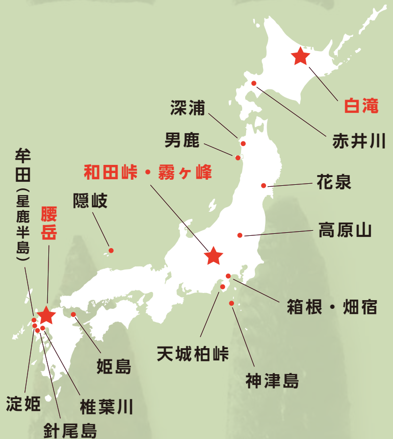
▲ 日本列島の主な黒曜石の原産地

最も美しい黒曜石は、透明度が高く縞の入った和田峠周辺の星ヶ塔系です。この黒曜石は単に刃物としてではなく、宝石的な付加価値を持っていました。例えば、縄文時代に作られた石匙(摘み付きナイフ)は、透明で縞の入った黒曜石を用いて、丁寧な押圧剥離で仕上げられています。また300gと大型の素材からつくられた可能性があります。このことから、良質な材料と高度な技術を結集して作られたと考えられ、貴重な威信材として流通したと考えられます。その根拠として、星ヶ塔系の黒曜石は、原産地から600キロ以上も離れた遺跡からも見つかっています。