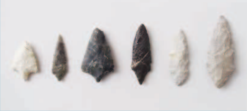
みやにし 宮西遺跡出土の石槍