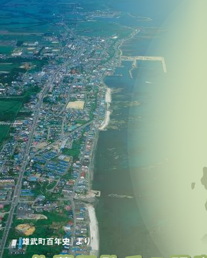
『雄武町百年史』より