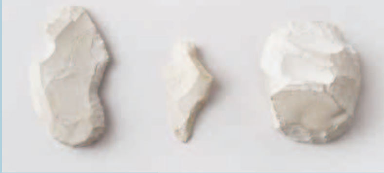
宮西遺跡出土のスクレイパー