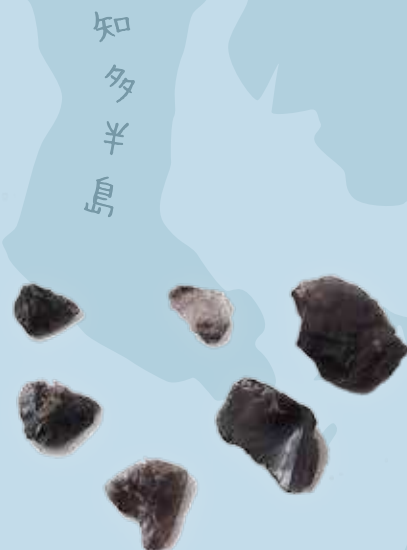
いしぜ 石瀬貝塚出土の黒曜石