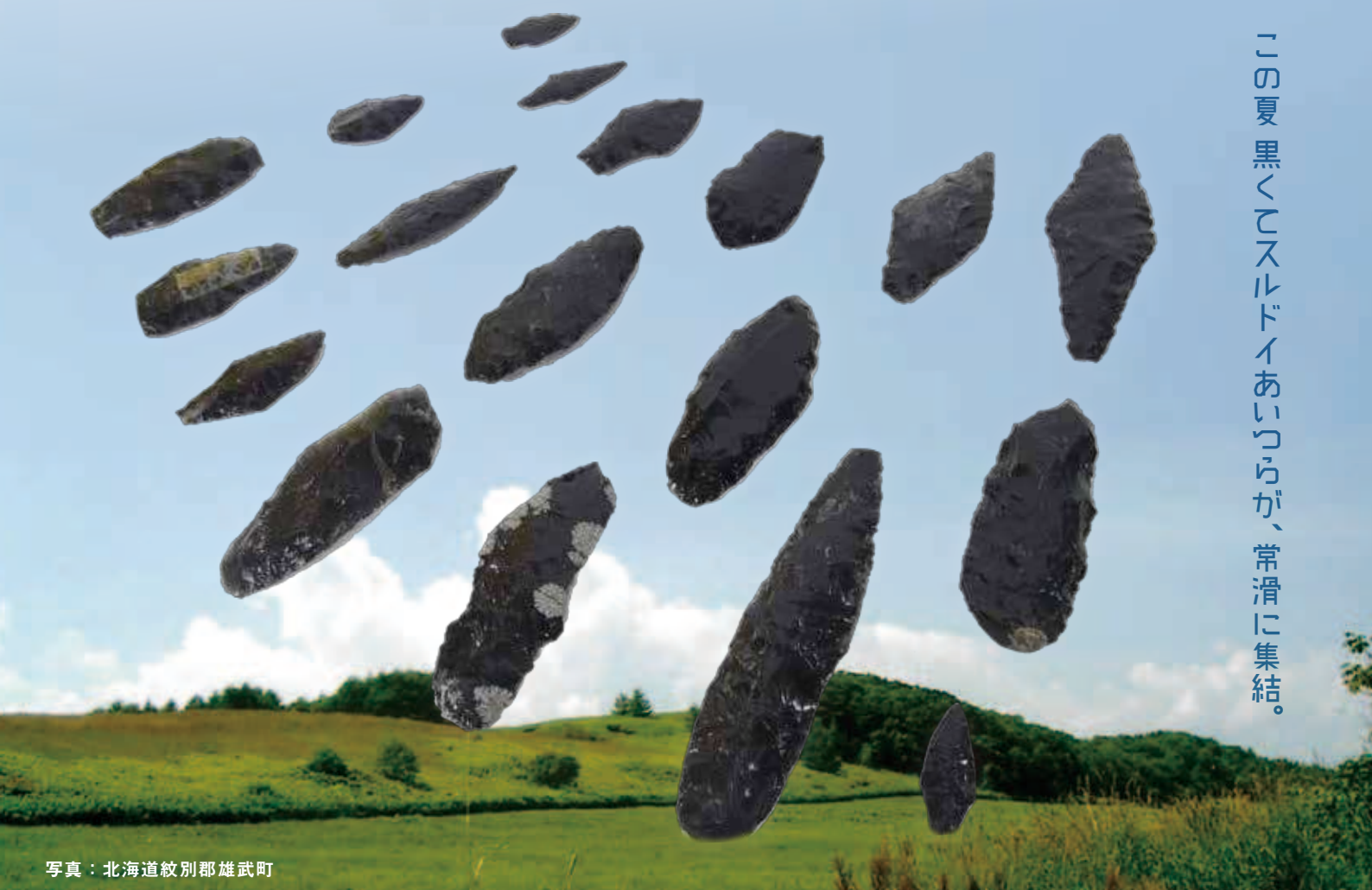
写真：北海道紋別郡雄武町