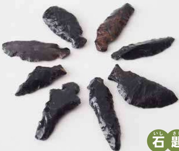
いし さじ 石 匙