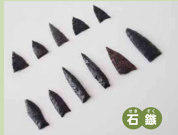
せき そく 石 鏃