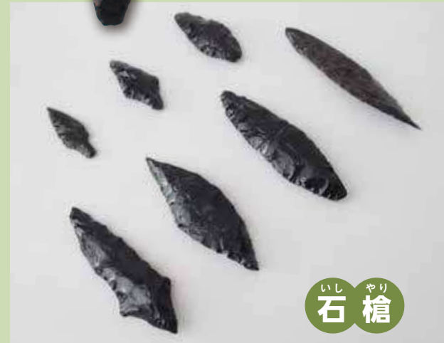
いし やり 石 槍