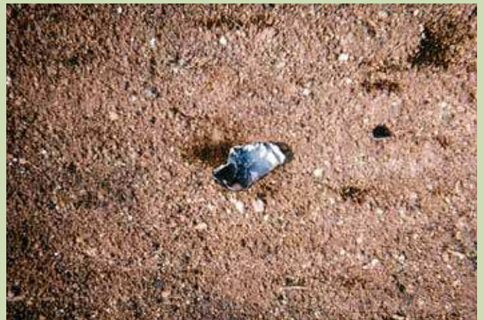
天地返しで発見された石器