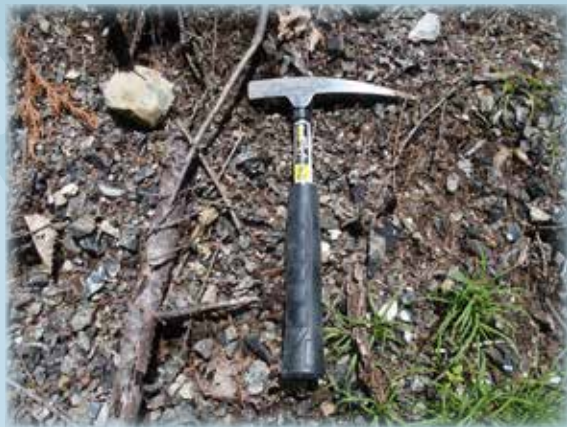
黒曜石の露頭（長野県霧ヶ峰）