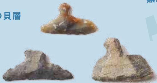
くすばさま 楠廻間貝塚出土の石鏃