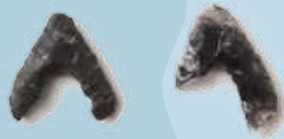
がんごう 雁合遺跡出土の石鋏