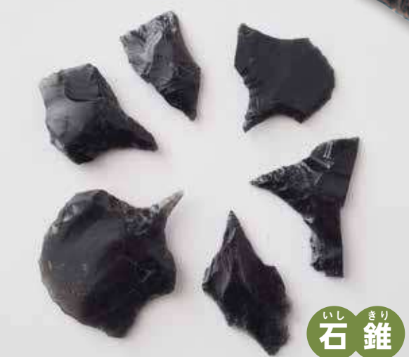
いし きり 石 鏃