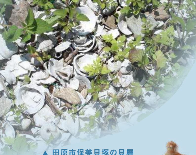
▲ 田原市保美貝塚の貝層