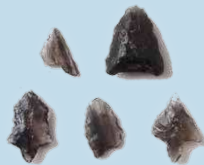
ばんき 田原市内の縄文時代晩期の石鋏

渥美半島でも知多半島と同様に黒曜石が貴重であったことに変わりはありませんが、石器に使われた主となる石材が大きく異なります。縄文時代草創期の宮西遺跡では、有舌尖頭器 ゆうぜつせんとうき と呼ばれるこの時代特有の狩猟具が見つっています。宮西遺跡はチャートを中心に熔結凝灰岩や頁岩などの白色に風化する石材が用いられています。北海道では黒曜石でスクレイパーがつくられていますが、渥美半島では白色の石材が多く用いられるなど地域の違いを見ることができます。黒曜石が使われはじめる縄文時代早期になると、白色に風化する石材が減少し、サヌカイトや下呂石 ろいし の割合が増えていきます。黒曜石は少量ですが、長野県産とともに関東方面からも流通した時代で、縄文人のダイナミックな活動が想像されます。渥美半島で黒曜石が増え始めるのは縄文時代後期から晩期の頃で吉胡 よしご ・伊川津 いかわづ ・保美 ほび の三大貝塚が形成された頃です。黒曜石は長野県産が主要となり、知多半島と同様にシカやイノシシ、トリなどの獲物を捕らえる石鋏がつけられました。